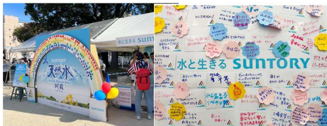
※イベントの様子、メッセージボード