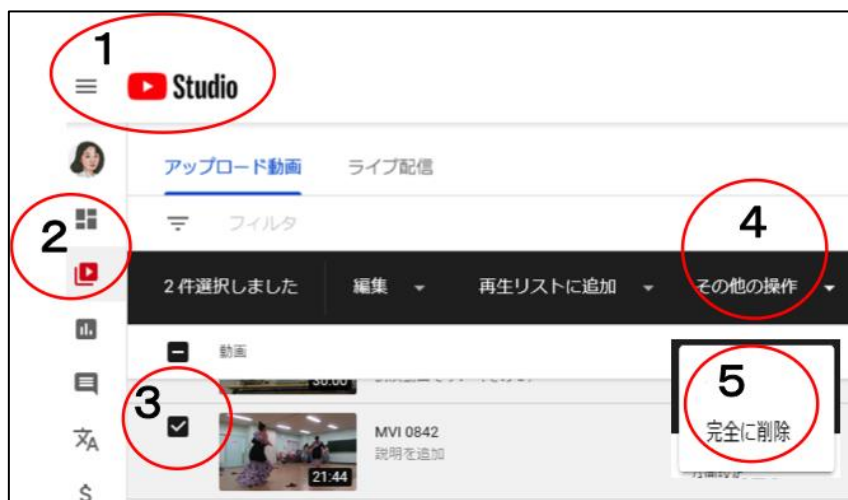
図：YouTube 動画を削除するステップ

ところで、相談者は11歳。YouTubeの利用規約の年齢に関する要件に、こう書かれています。