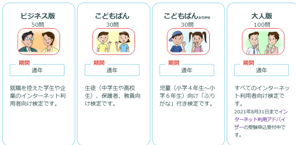
図：インターネットルール&マナー検定