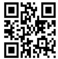
チャイルドライン