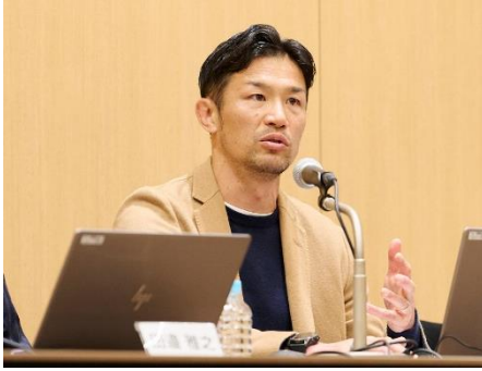
基調報告・パネリスト 廣瀬 俊朗 (株式会社H i R A K U 代表取締役/元ラ グビー日本代表キャプテン)