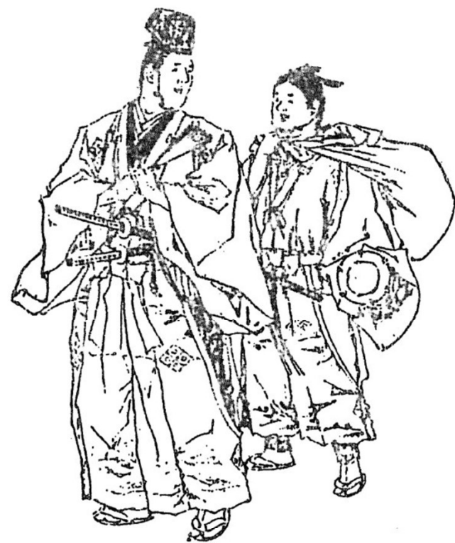
千秋萬歲 (太夫・才藏)