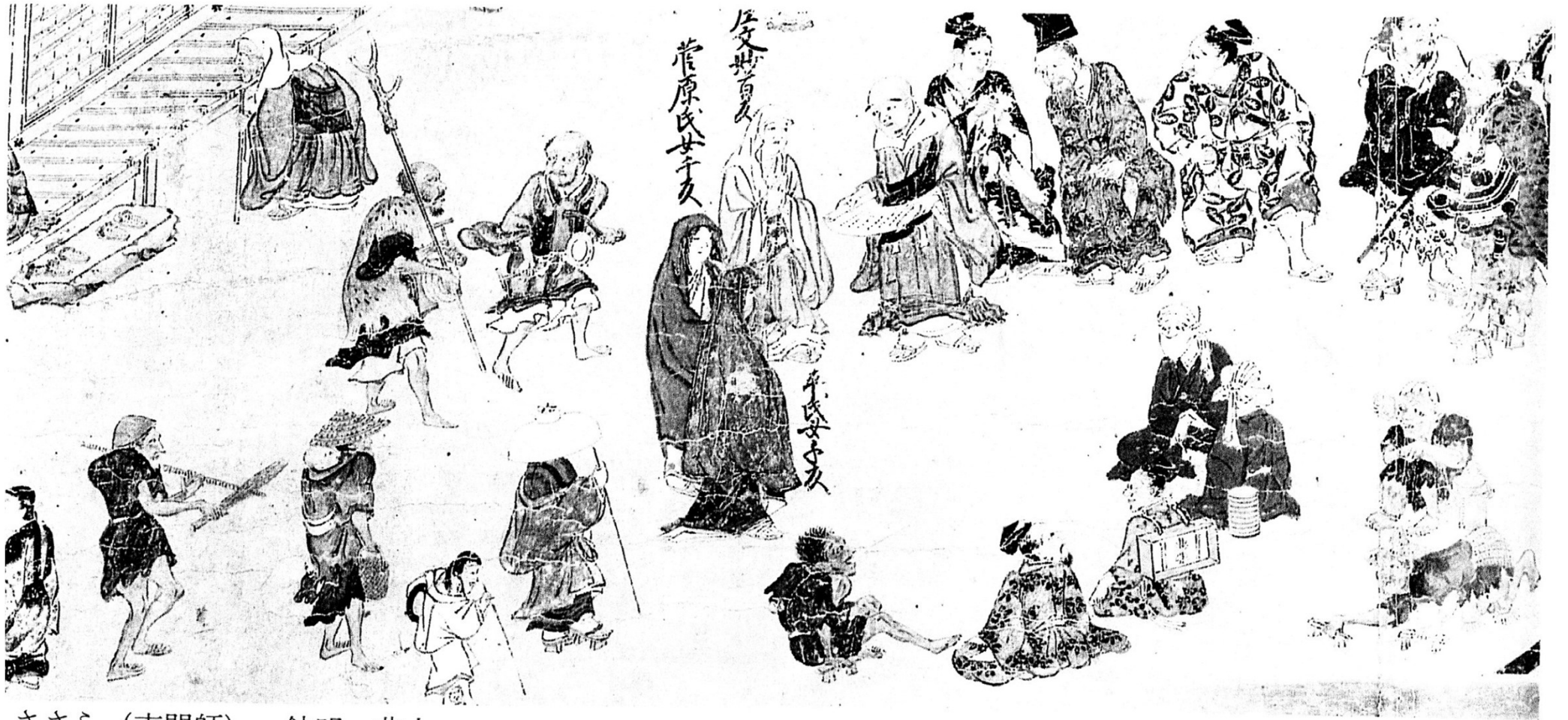
ささら (声聞師) 鉢叩 非人