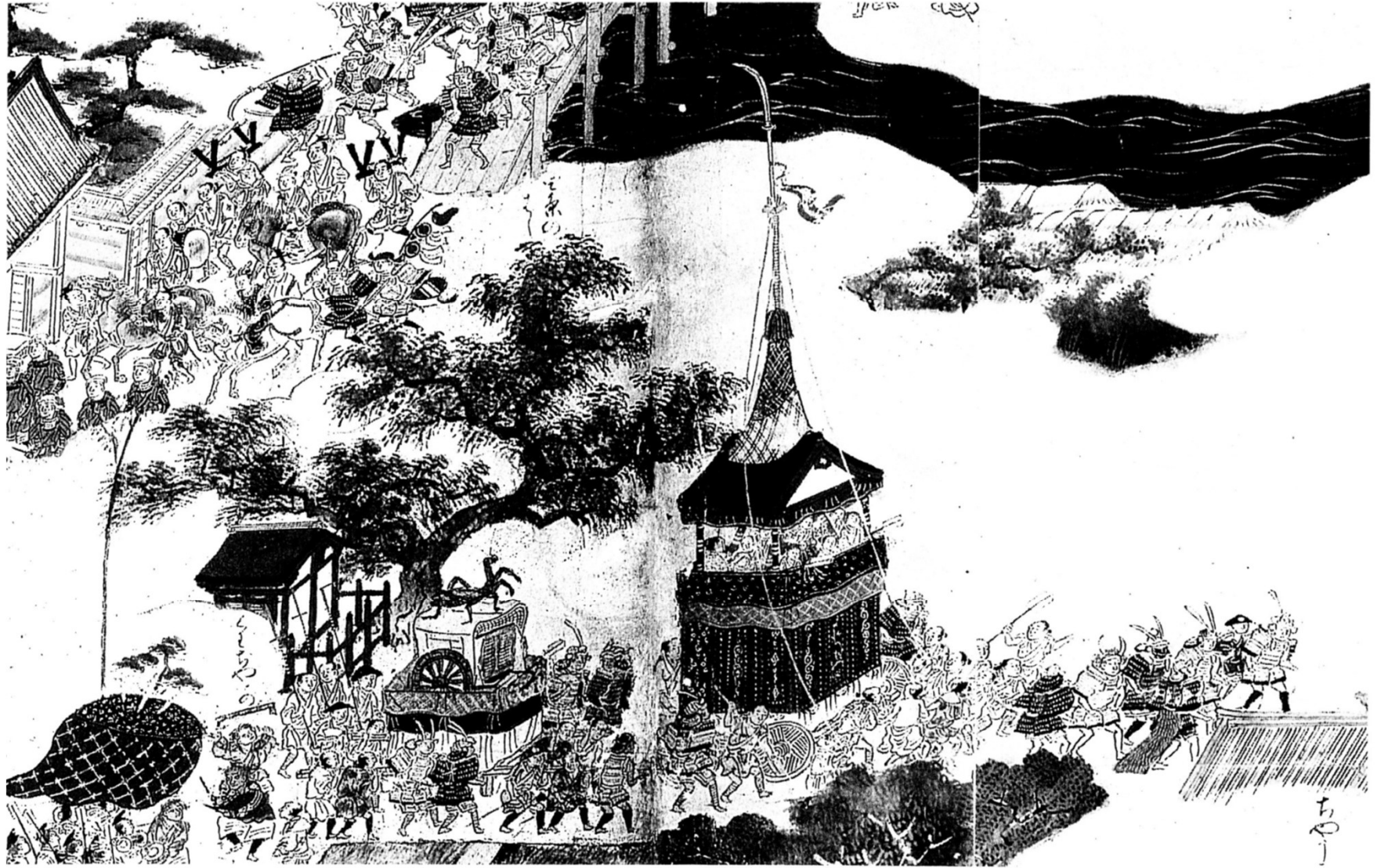
清目 (祇園社・犬神人)