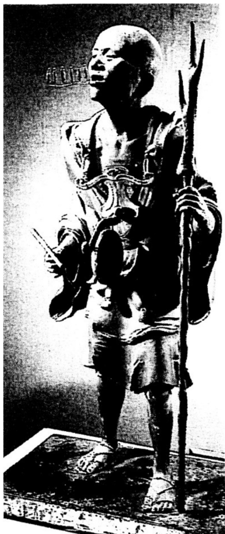
空也上人像（六波羅蜜寺）