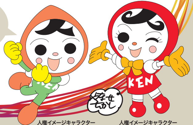
人権イメージキャラクター 人KENまもる君