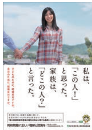
平成27年度同和問題啓発ポスター(制作:香川県) 平成28年度人権啓発資料法務大臣表彰 ポスター部門 優秀賞 受賞作品